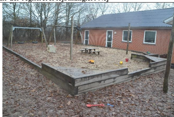
Redskab: Sandkasse Årgang: 1998 Producent: Egen produktion Er redskabet mærket: Ja Er der registreret fejl/mangler: Ja