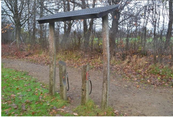
Redskab: Tankstation Årgang: 2016 Producent: Kompan Er redskabet mærket: Ja Er der registreret fejl/mangler: Nej