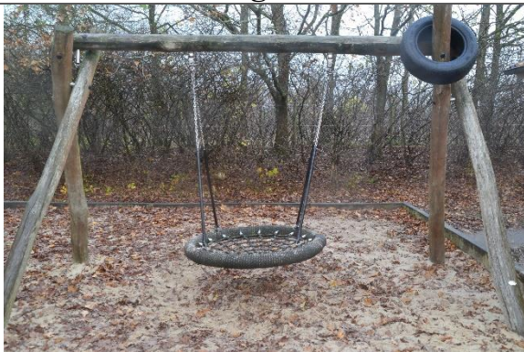
Redskab: Fugleredegynge Årgang: Producent: Er redskabet mærket: Ulæseligt Er der registreret fejl/mangler: Nej