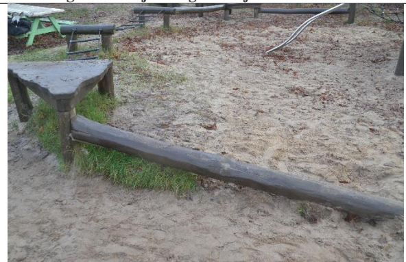
Redskab: Balancebom Årgang: 2010 Producent: Danske Legepladser Er redskabet mærket: Ja Er der registreret fejl/mangler: Nej