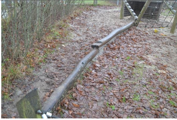
Redskab: Balancebomme Årgang: 2010 Producent: Danske Legepladser Er redskabet mærket: Ja Er der registreret fejl/mangler: Nej