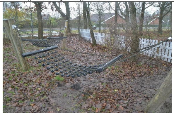
Redskab: Hængekøjer Årgang: 2016 Producent: Kompan Er redskabet mærket: Ja Er der registreret fejl/mangler: Nej