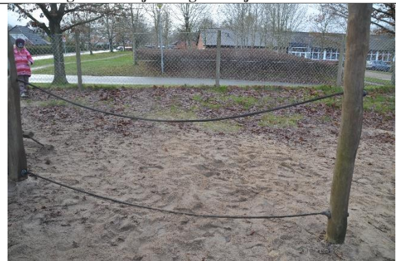
Redskab: Balancereb Årgang: 2010 Producent: Danske Legepladser Er redskabet mærket: Ja Er der registreret fejl/mangler: Nej