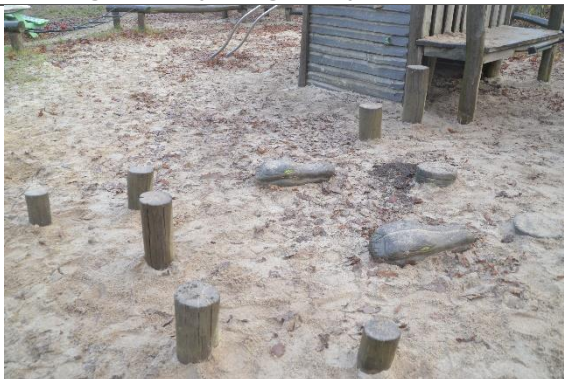
Redskab: Balancestolper Årgang: 2010 Producent: Danske Legepladser Er redskabet mærket: Ja Er der registreret fejl/mangler: Nej