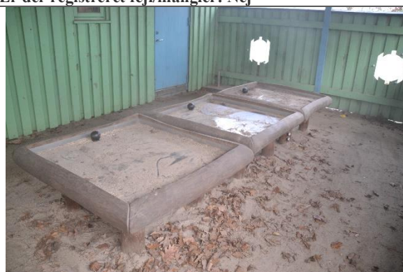
Redskab: Sandleg Årgang: 2016 Producent: Kompan Er redskabet mærket: Ja Er der registreret fejl/mangler: Nej