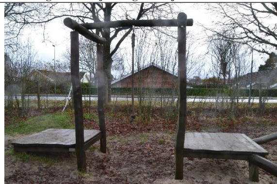
Redskab: Svingreb Årgang: 2010 Producent: Danske Legepladser Er redskabet mærket: Ja Er der registreret fejl/mangler: Nej