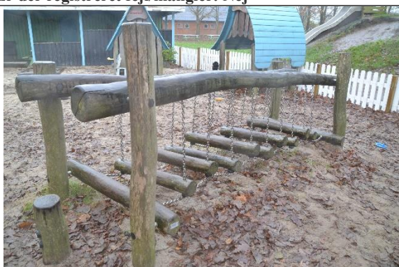
Redskab: Hængebro Årgang: 2016 Producent: Kompan Er redskabet mærket: Ja Er der registreret fejl/mangler: Nej