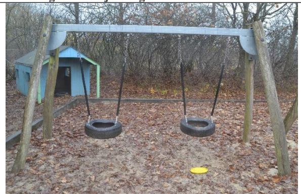
Redskab: Gyngestativ Årgang: Producent: Er redskabet mærket: Nej Er der registreret fejl/mangler: Ja