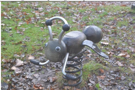
Redskab: Vippedyr Årgang: 2016 Producent: Kompan Er redskabet mærket: Ja Er der registreret fejl/mangler: Nej