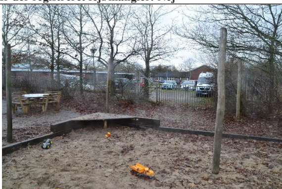
Redskab: Stolper til læsejl Årgang: Producent: Er redskabet mærket: Ja Er der registreret fejl/mangler: Nej