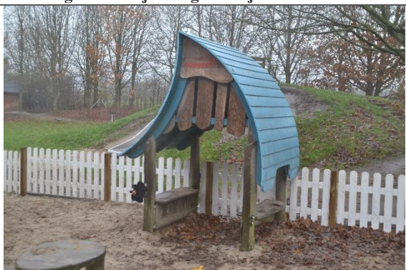
Redskab: Legehus Årgang: 2016 Producent: Kompan Er redskabet mærket: Ja Er der registreret fejl/mangler: Nej