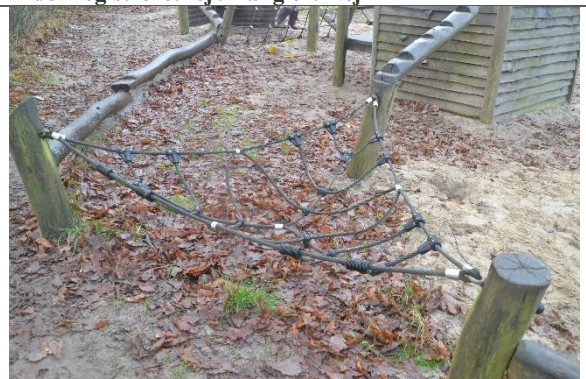
Redskab: Balancenet Årgang: 2010 Producent: Danske Legepladser Er redskabet mærket: Ja Er der registreret fejl/mangler: Nej