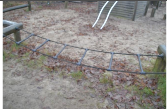
Redskab: Balancenet Årgang: 2010 Producent: Danske Legepladser Er redskabet mærket: Ja Er der registreret fejl/mangler: Nej