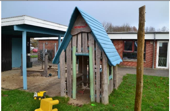
Redskab: Legehus Årgang: 2016 Producent: Kompan Er redskabet mærket: Ja Er der registreret fejl/mangler: Nej