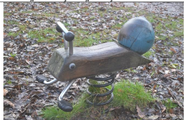
Redskab: Vippedyr Årgang: 2016 Producent: Kompan Er redskabet mærket: Ja Er der registreret fejl/mangler: Nej