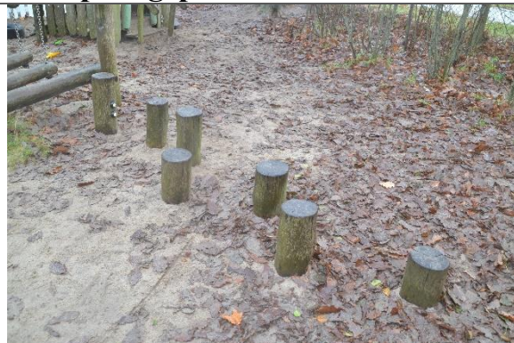
Redskab: Balancestolper Årgang: 2016 Producent: Kompan Er redskabet mærket: Ja Er der registreret fejl/mangler: Nej