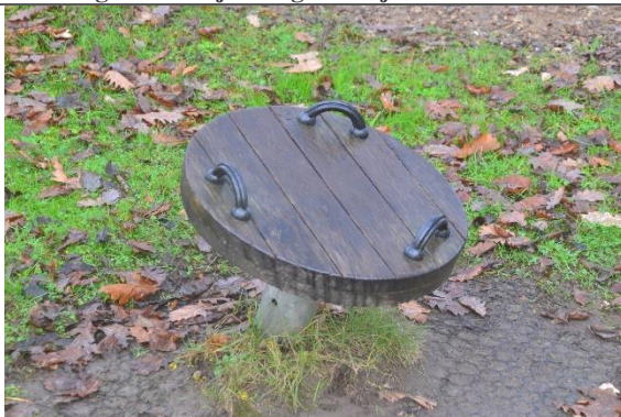
Redskab: Mini-karrusel Årgang: 2016 Producent: Kompan Er redskabet mærket: Ja Er der registreret fejl/mangler: Ja