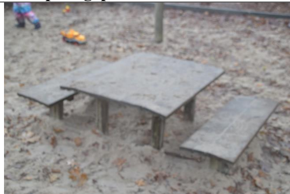
Redskab: Sandbord Årgang: Producent: Er redskabet mærket: Nej Er der registreret fejl/mangler: Nej