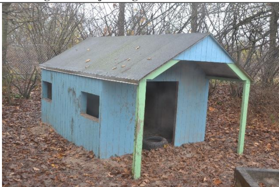
Redskab: Legehus Årgang: Producent: Er redskabet mærket: Nej Er der registreret fejl/mangler: Nej