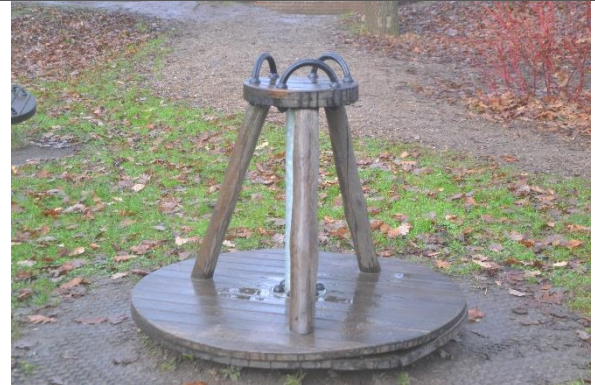
Redskab: Karrusel Årgang: 2016 Producent: Kompan Er redskabet mærket: Ja Er der registreret fejl/mangler: Ja