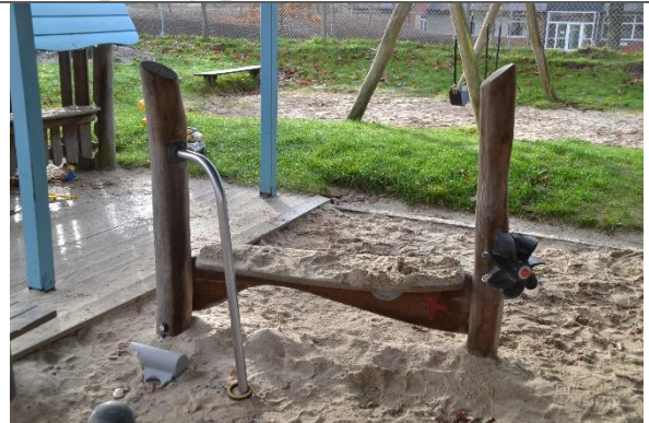
Redskab: Sandbord Årgang: 2016 Producent: Kompan Er redskabet mærket: Ja Er der registreret fejl/mangler: Nej