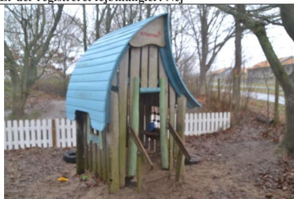
Redskab: Legehus Årgang: 2016 Producent: Kompan Er redskabet mærket: Ja Er der registreret fejl/mangler: Nej