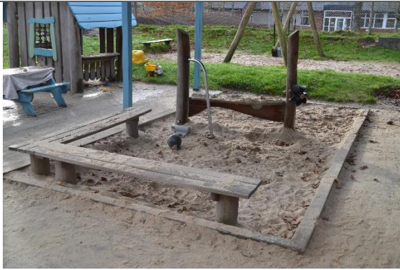
Redskab: Sandkasse Årgang: Producent: Er redskabet mærket: Nej Er der registreret fejl/mangler: Nej