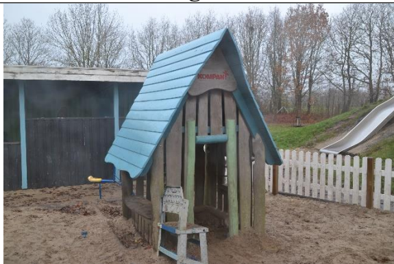
Redskab: Legehus Årgang: 2016 Producent: Kompan Er redskabet mærket: Ja Er der registreret fejl/mangler: Nej