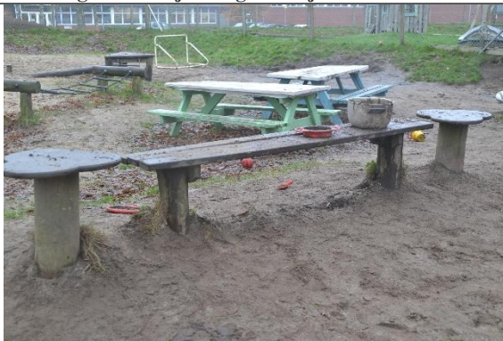
Redskab: Sandborde Årgang: Producent: Er redskabet mærket: Nej Er der registreret fejl/mangler: Nej