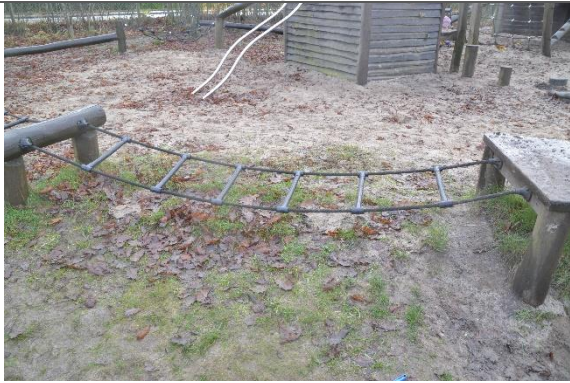
Redskab: Balancenet Årgang: 2010 Producent: Danske Legepladser Er redskabet mærket: Ja Er der registreret fejl/mangler: Nej