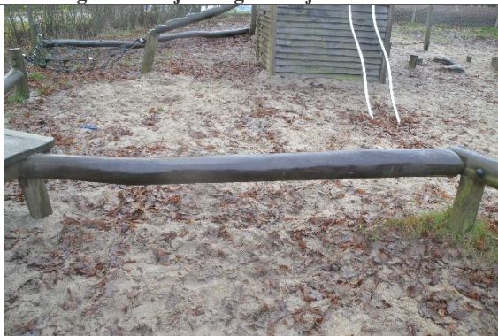
Redskab: Balancebom Årgang: 2010 Producent: Danske Legepladser Er redskabet mærket: Ja Er der registreret fejl/mangler: Nej