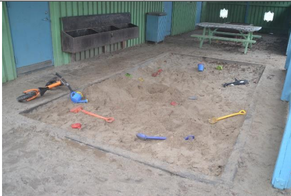
Redskab: Sandkasse Årgang: Producent: Er redskabet mærket: Nej Er der registreret fejl/mangler: Nej