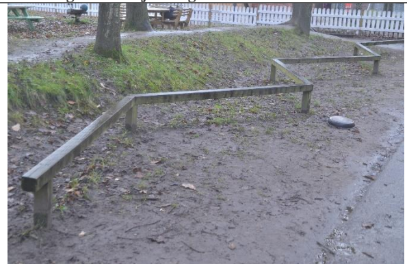
Redskab: Balancebom Årgang: Producent: Er redskabet mærket: Nej Er der registreret fejl/mangler: Ja