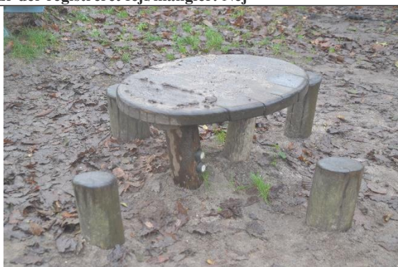
Redskab: Sandbord Årgang: 2016 Producent: Kompan Er redskabet mærket: Ja Er der registreret fejl/mangler: Nej