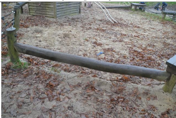
Redskab: Balancebom Årgang: 2010 Producent: Danske Legepladser Er redskabet mærket: Ja Er der registreret fejl/mangler: Nej