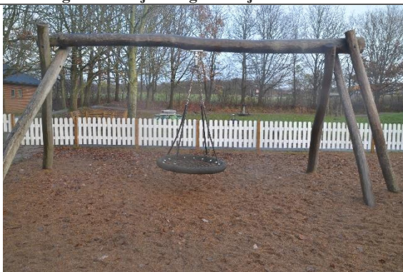
Redskab: Fugleredegynge Årgang: 2016 Producent: Norleg Er redskabet mærket: Ja Er der registreret fejl/mangler: Nej