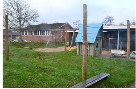
Redskab: Stolper til læsejl Årgang: Producent: Er redskabet mærket: Nej Er der registreret fejl/mangler: Nej