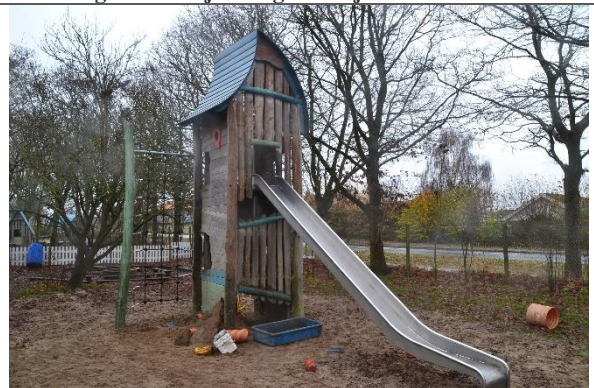
Redskab: Klatrestativ med rutsjebane Årgang: 2016 Producent: Kompan Er redskabet mærket: Ja Er der registreret fejl/mangler: Ja