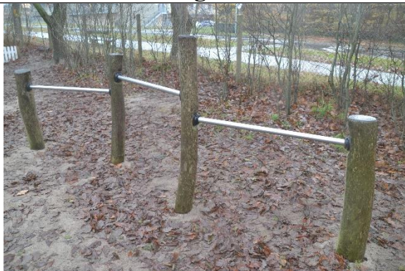
Redskab: Svingbom Årgang: 2016 Producent: Kompan Er redskabet mærket: Ja Er der registreret fejl/mangler: Nej