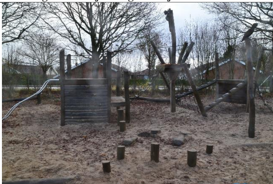
Redskab: Klatrestativ Årgang: 2010 Producent: Danske Legepladser Er redskabet mærket: Ja Er der registreret fejl/mangler: Nej