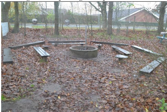
Redskab: Bålsted Ikke omfattet af DS/EN 1176