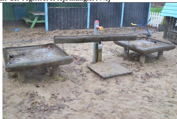
Redskab: Vandleg Årgang: 2016 Producent: Kompan Er redskabet mærket: Ja Er der registreret fejl/mangler: Nej