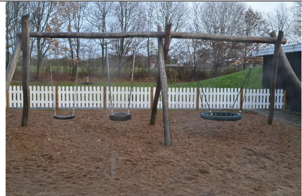
Redskab: Gyngestativ Årgang: 2016 Producent: Kompan Er redskabet mærket: Ja Er der registreret fejl/mangler: Nej