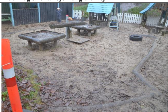
Redskab: Sandkasse Årgang: Producent: Er redskabet mærket: Nej Er der registreret fejl/mangler: Nej