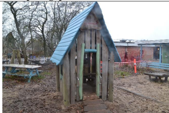
Redskab: Legehus Årgang: 2016 Producent: Kompan Er redskabet mærket: Ja Er der registreret fejl/mangler: Nej