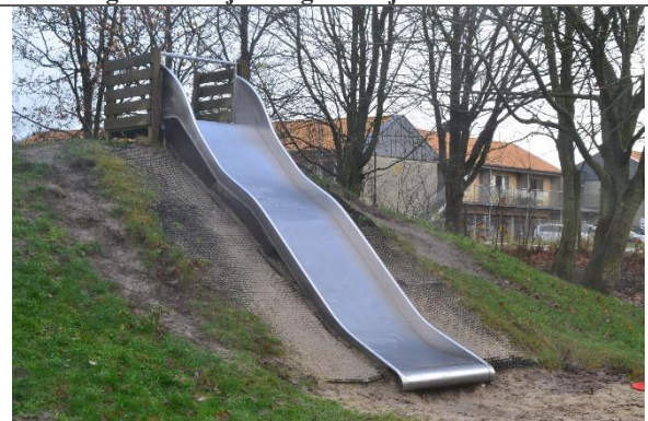
Redskab: Terrænruksjebane Årgang: Producent: Er redskabet mærket: Nej Er der registreret fejl/mangler: Ja