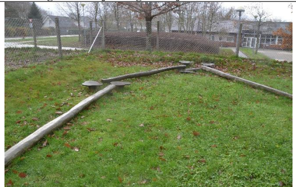
Redskab: Balanceforløb Årgang: 2016 Producent: Kompan Er redskabet mærket: Ja Er der registreret fejl/mangler: Nej