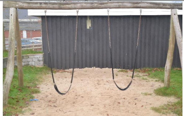
Redskab: Gyngestativ Årgang: 2010 Producent: Danske Legepladser Er redskabet mærket: Ja Er der registreret fejl/mangler: Nej