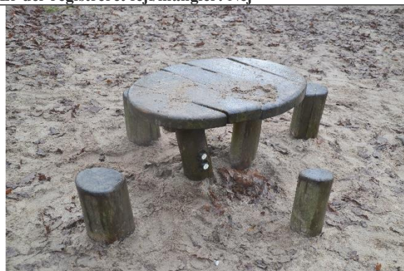
Redskab: Sandbord Årgang: 2016 Producent: Kompan Er redskabet mærket: Ja Er der registreret fejl/mangler: Nej