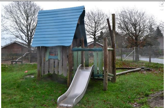
Redskab: Klatrestativ med rutsjebane Årgang: 2016 Producent: Kompan Er redskabet mærket: Ja Er der registreret fejl/mangler: Nej