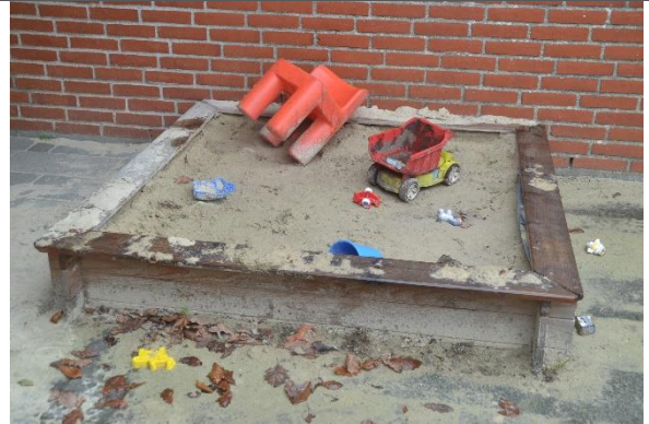
Redskab: Sandkasse Årgang: Producent: Er redskabet mærket: Nej Er der registreret fejl/mangler: Nej