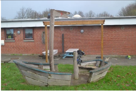
Redskab: Legeskib Årgang: 2016 Producent: Kompan Er redskabet mærket: Ja Er der registreret fejl/mangler: Nej